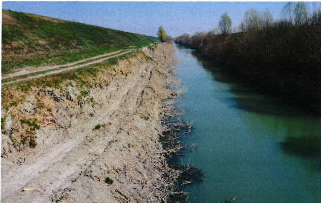
(Fiume Panaro: vista da monte del dissesto in sponda sx)

[Stralcio aereo estratto da google-earth: fiume Panaro – Comune di Finale Emilia (MO)]